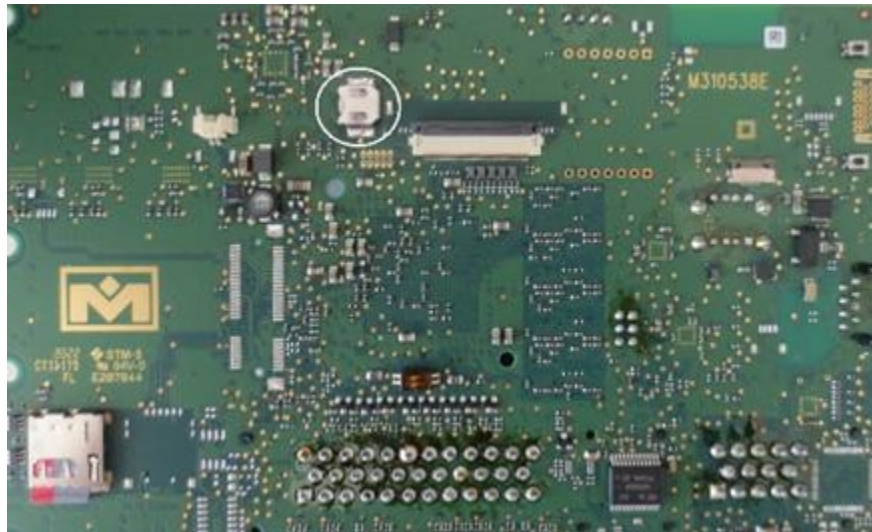
Abbildung 3: Lokalisation der Batterie (weißer Kreis) auf der Platine des MConn 7.

Der Zusammenbau erfolgt in umgekehrter Reihenfolge. Montieren Sie das Steuergerät wieder im Fahrzeug. Beachten Sie die Anweisungen in Kapitel 6 Montage.